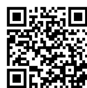
「アイデアマーケット」