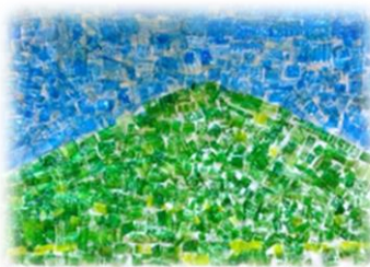
プラごみを使った作品